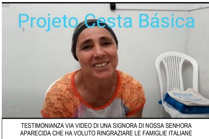
TESTIMONIANZA VIA VIDEO DI UNA SIGNORA DI NOSSA SENHORA APARECIDA CHE HA VOLUTO RINGRAZIARE LE FAMIGLIE ITALIANE

A gennaio 2020 sono state rendicontate tutte le spese effettuate dalle famiglie per R$ 7.864,77. Tutte le spese hanno riguardato la sola categoria degli alimenti.