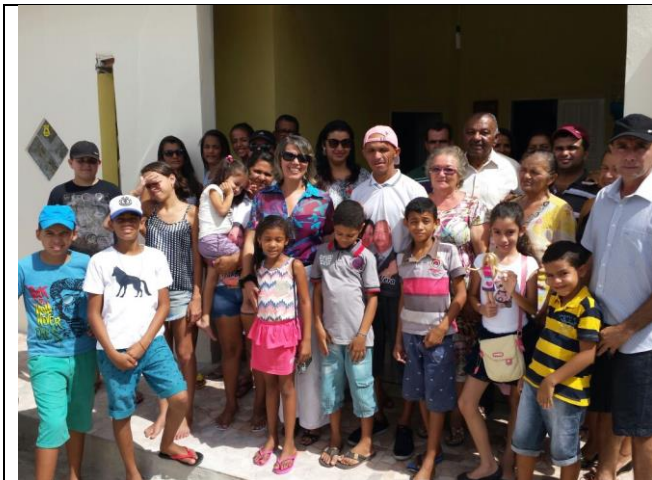
MARZO 2016: FESTA DI INAUGURAZIONE DELLA NUOVA CASA